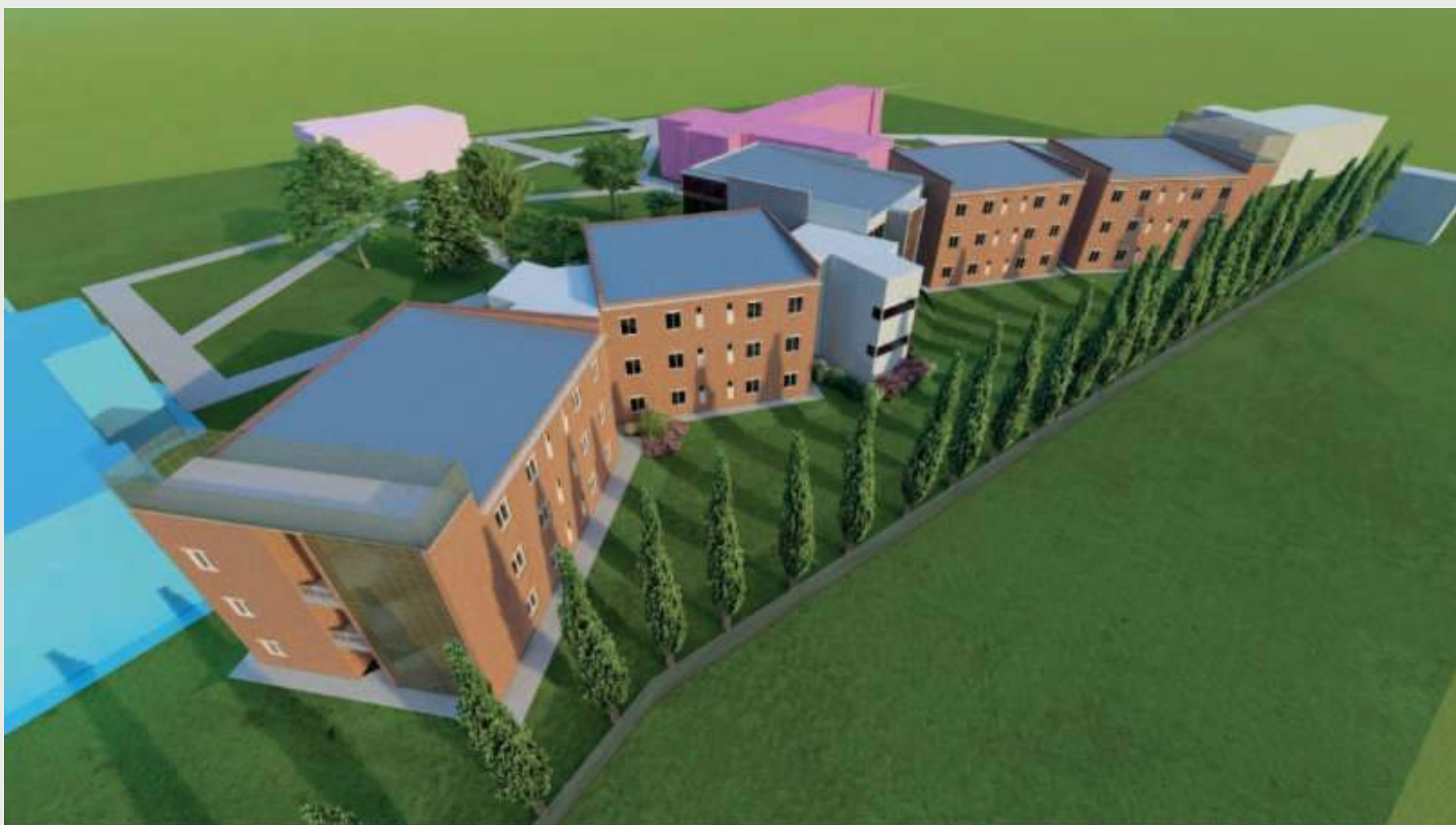
Vista Este • Vuelo de Pájaro