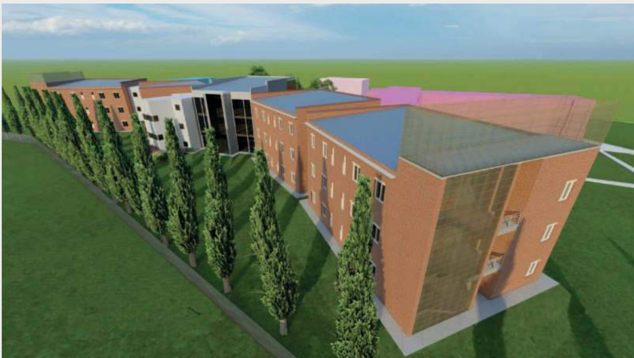
Vista Oeste • Vuelo de Pájaro