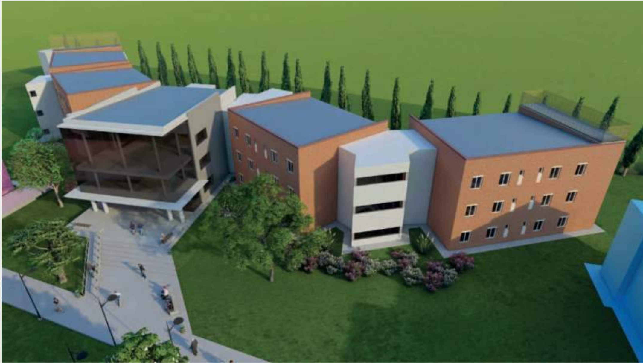
Vista Sur • Vuelo de Pájaro