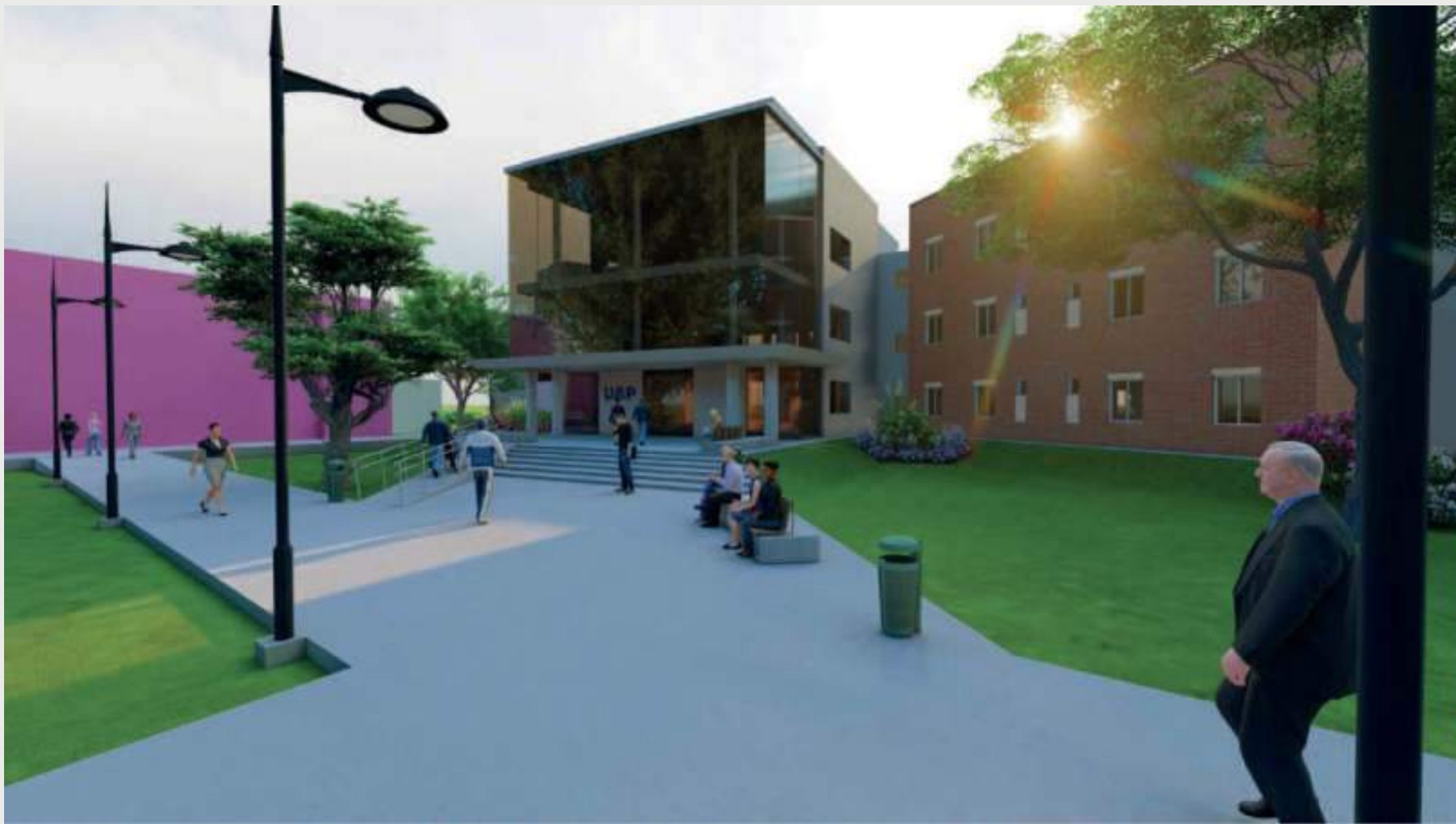
Vista Sur • Ingreso Principal